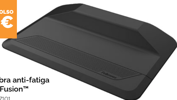
Alfombra anti-fatiga ActiveFusion™